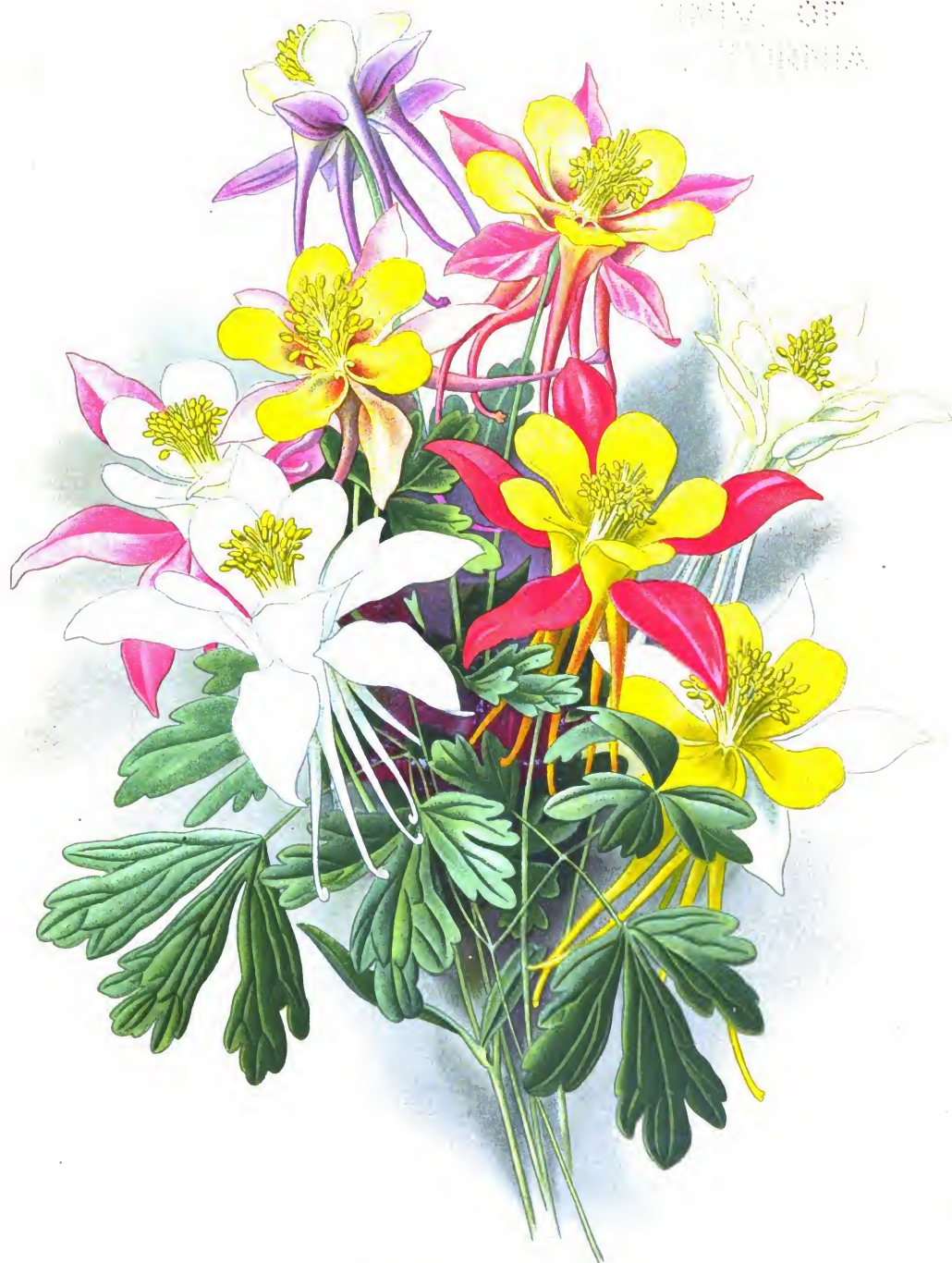
Aquilegia vulgaris hybrida.